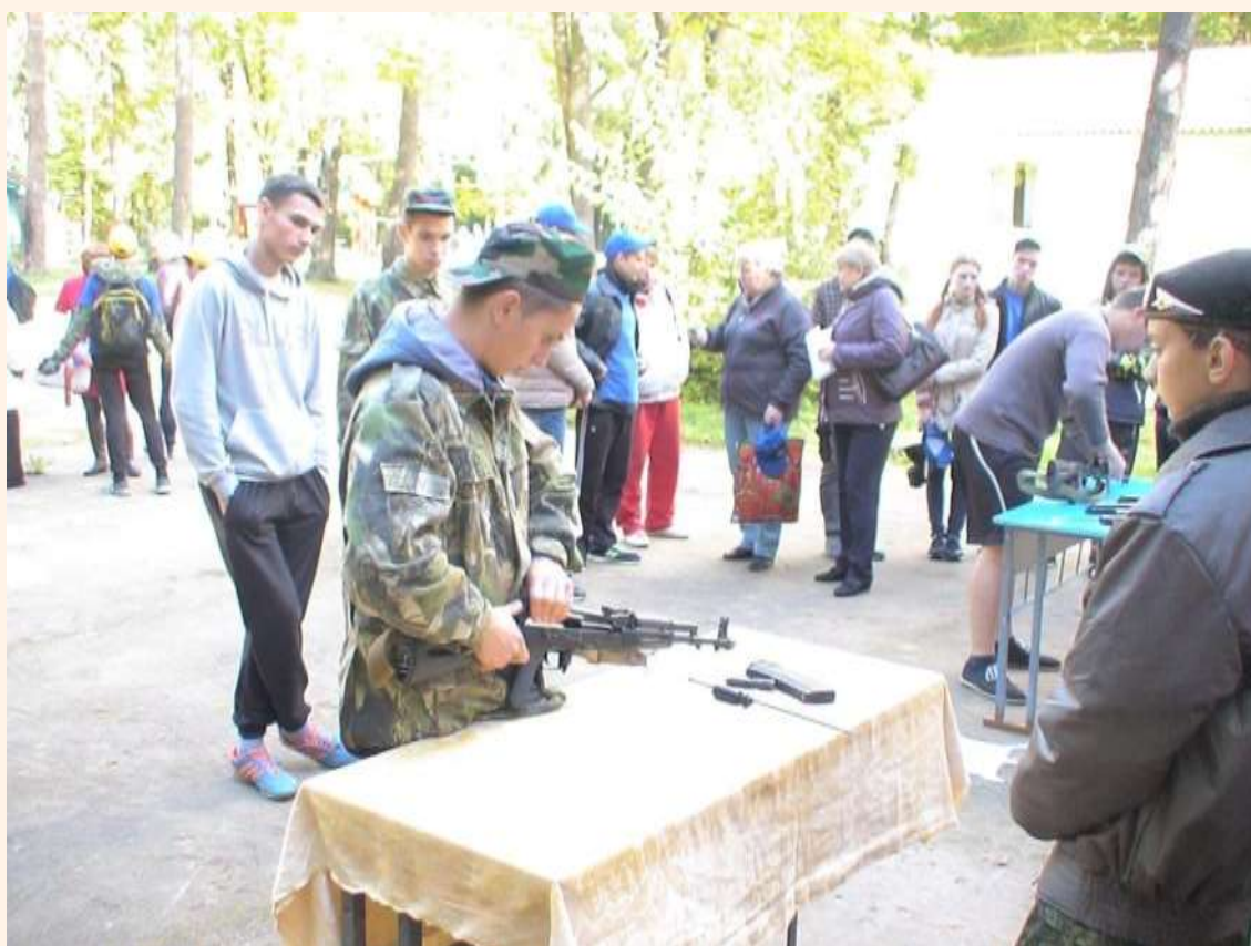
Разборка-сборка автомата АК-74