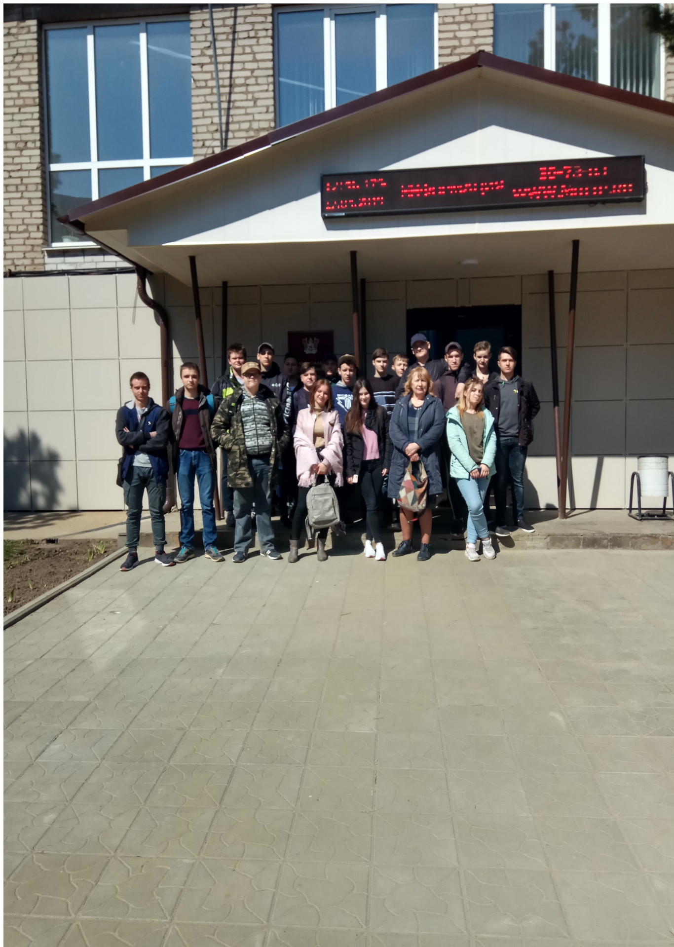
В трамвайном депо