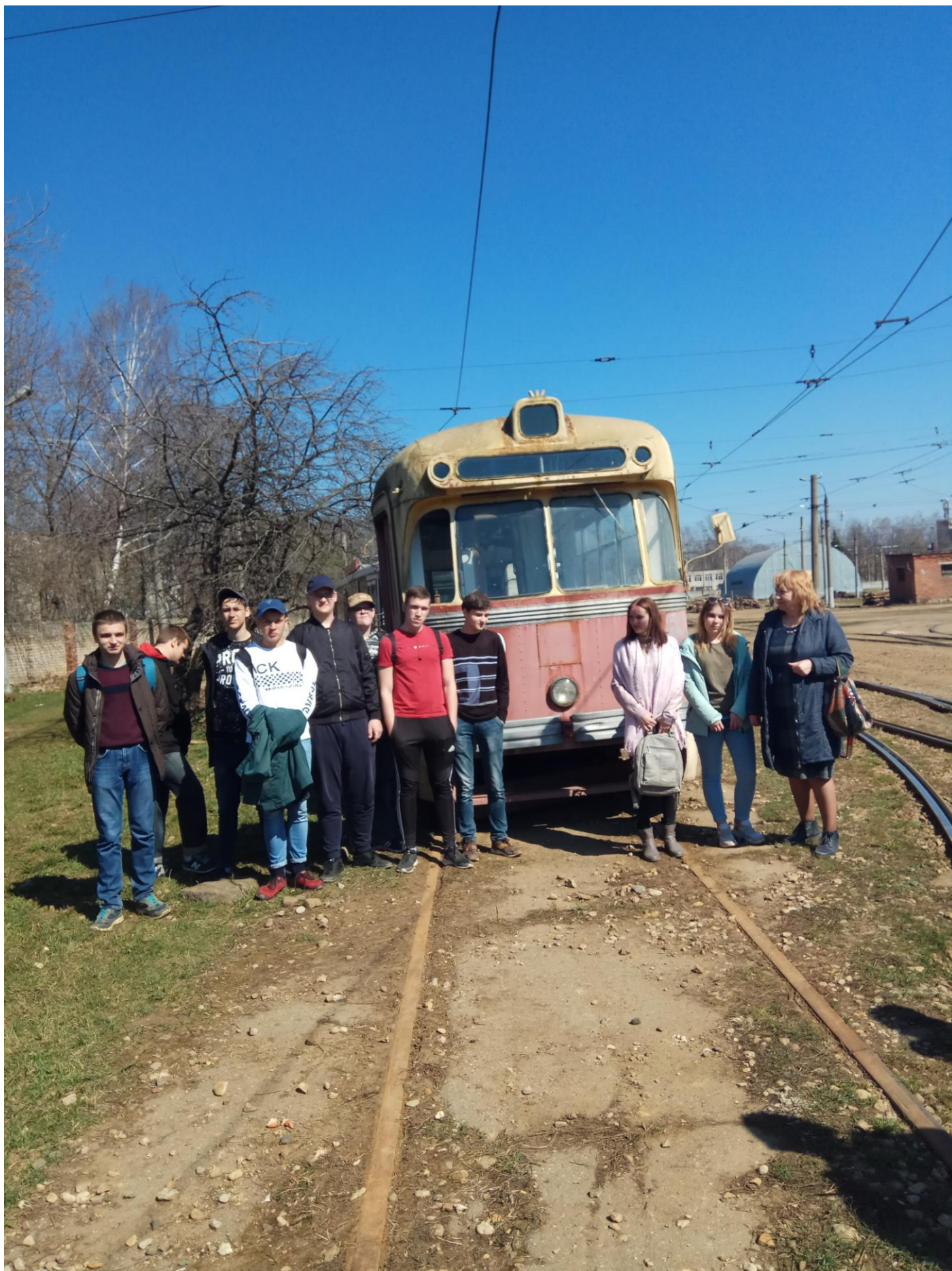
В трамвайном депо