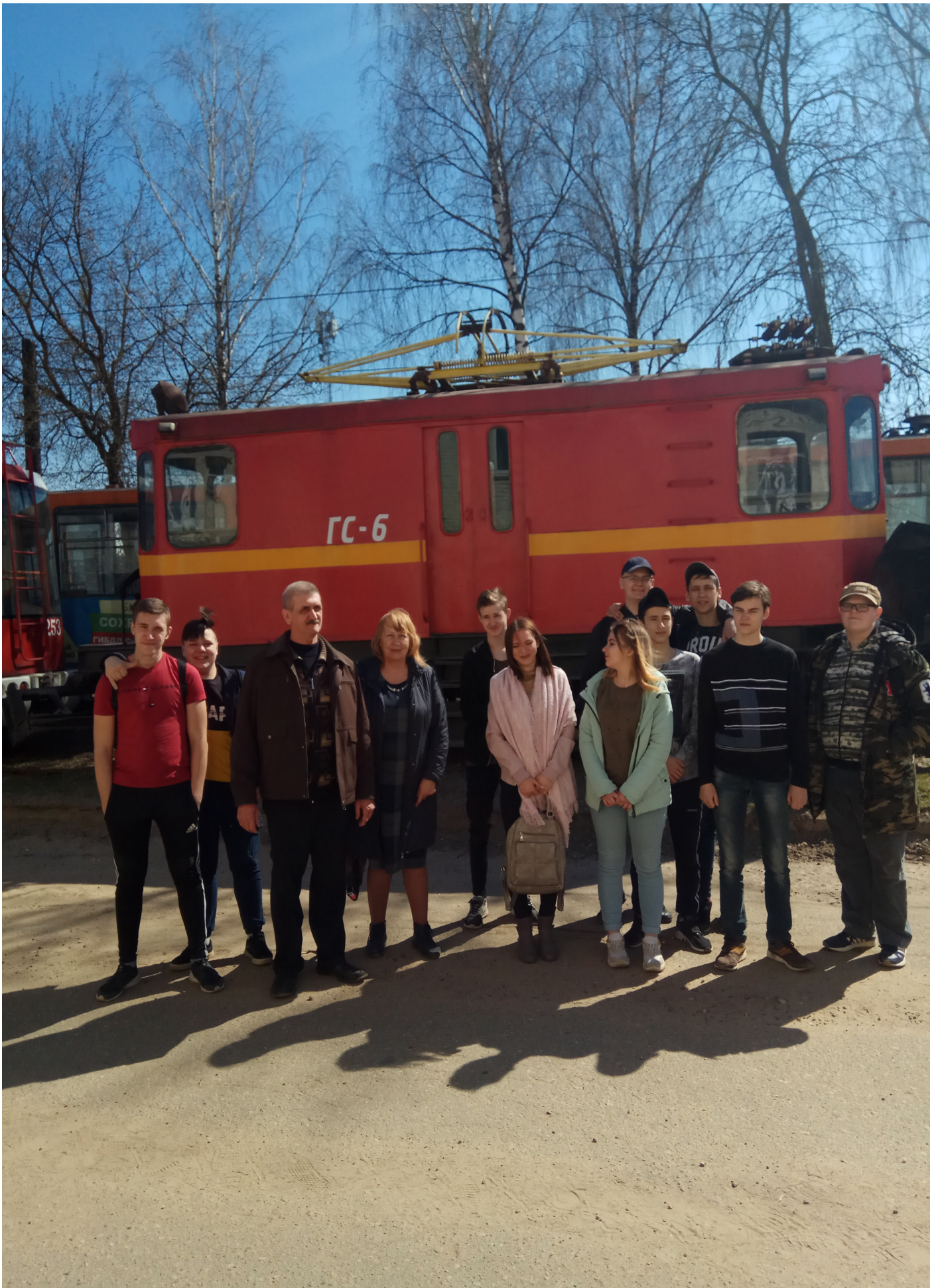
В трамвайном депо